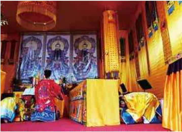
2018年青城山羅天大醮期間香港飛雁洞佛道社三元懺上表

體作為傀儡來傳達旨意。勞格文(John Lagerwey)教授精闢地將其總結為：巫師被鬼神控制(controlled by spirits)與道士控制鬼神(control spirits)。