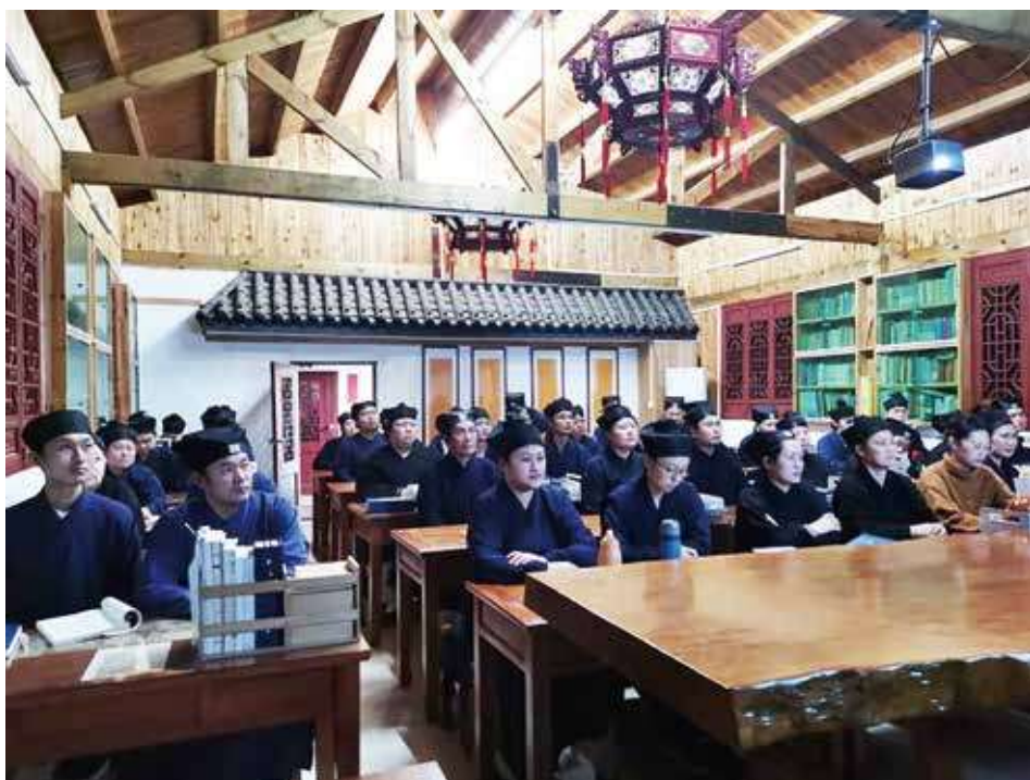
武漢大道觀組織道眾觀看本講課程

本講開始前，微信公眾號「佛研資訊」採訪了著名學者曹凌老師，曹老師在採訪中高度評價並推薦了本課程，他講道：「最近比較值得關注的則有西南交通大學所舉辦的一系列線上課程。這些課程由道教儀式史最頂尖的專家呂鵬志教授主持，請來了國內外相關領域學有專長的學者講授自己最得意的研究內容。其範圍也並不限於道教，而是也包括佛教文獻以及佛教儀式等方面。同時它又有鮮明的專註於儀式研究的特色，可謂別開生面。我想這一系列的線上課程會為將來中國宗教史的研究，尤其儀式史的研究培養很多人才，打開新