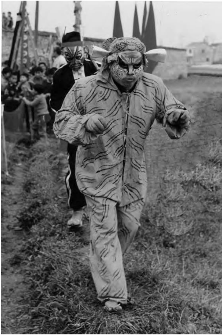
圖 4: 捉妖 (一)